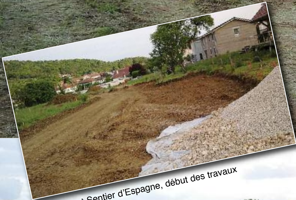
Lotissement Sentier d'Espagne, début des travaux